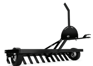
SCHOTTERHARKE 953 51 24-01