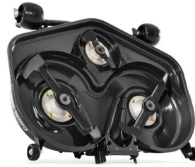
MÄHWERK 967 62 89-01