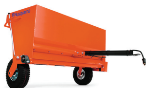
STREUWAGEN PROFİ 953 52 49-01