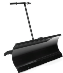
SCHNEERÄUMSCHILD 593 02 50-01