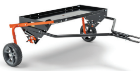
PLATTFORM 586 63 72-01