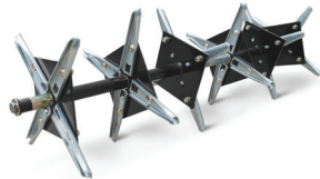
STERN-AERIFIZIERWELLE 588 21 27-01