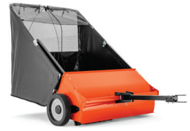
RASENKEHRMASCHINE 582 71 99-01