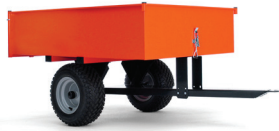
ANHÄNGER PROFİ 953 51 17-02