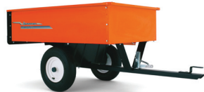
ANHÄNGER 275 501 00 82-01