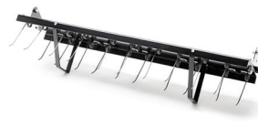
ENTMOOSER 586 63 68-01