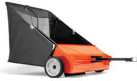
RASENKEHRMASCHINE 586 63 65-01