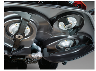
MÄHWERK 967 62 90-01