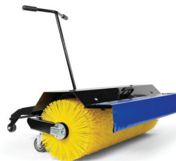
KEHRBÜRSTE 593 02 43-01