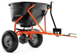
STREUWAGEN 75 967 02 72-01