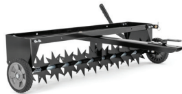
RASENLÜFTER 586 63 67-02